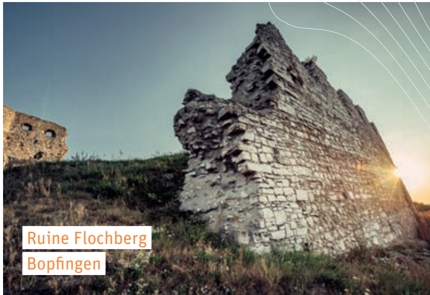
Ruine Flochberg Bopfingen