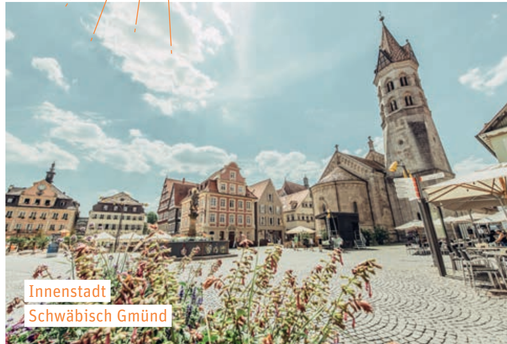
Innenstadt Schwäbisch Gmünd