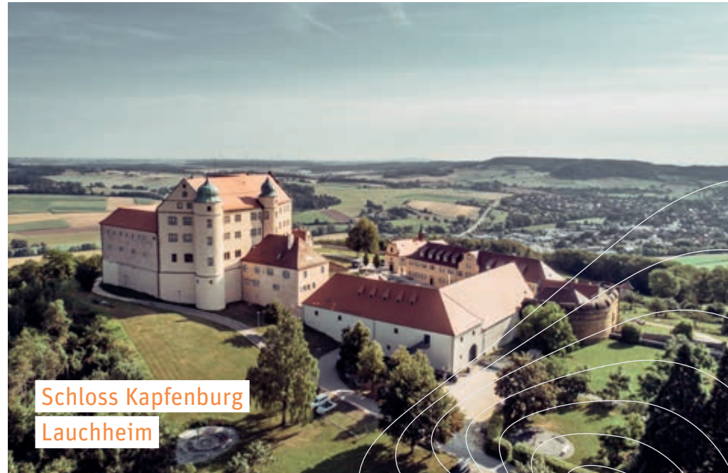
Schloss Kapfenburg Lauchheim