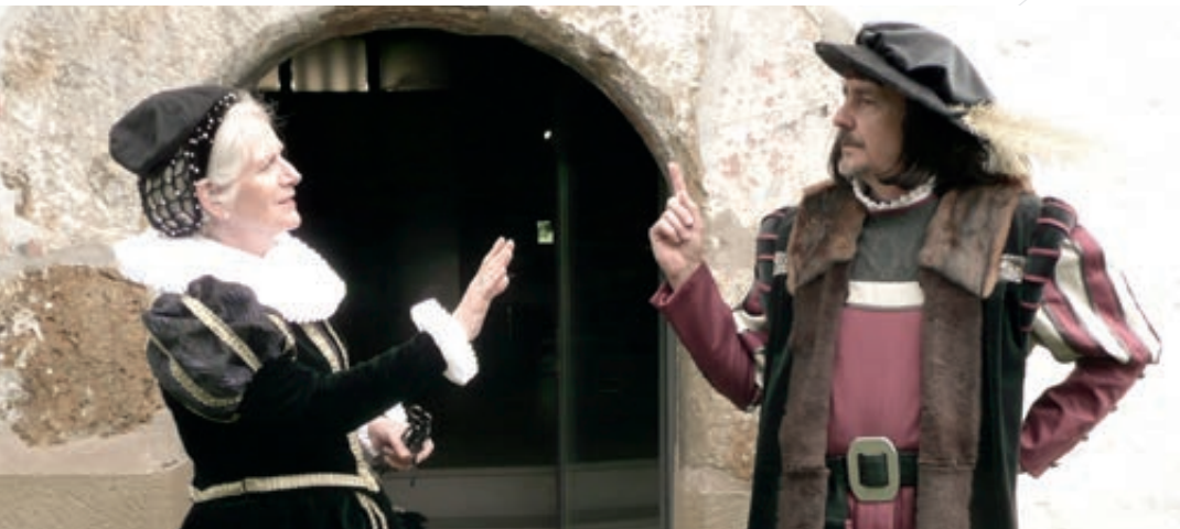
Szene aus historischer Stadtführung