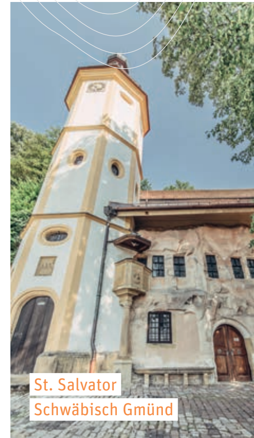
St. Salvator Schwäbisch Gmünd