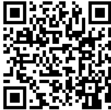
QR-Code Meine Umwelt-App

Weitere Informationen zur Asiatischen Hornisse und wie sich die Art von heimischen Insekten unterscheiden lässt finden sich auf der Homepage der LUBW https://www.lubw.baden-wuerttemberg.de/natur-und-landschaft/asiatische-hornisse sowie auf der Homepage der Landesanstalt für Bienenkunde der Universität Hohenheim unter https://bienenkunde.uni-hohenheim.de/vespavelutina . Dort finden sich auch weitere Informationen, wie Bürgerinnen und Bürger aktiv bei der Suche nach Tieren und Nestern mitwirken können. Seit April 2024 koordiniert die Landesanstalt für Bienenkunde in Stuttgart-Hohenheim im Auftrag der Naturschutzverwaltung das landesweite Management der Asiatischen Hornisse (Kontakt siehe Homepage).