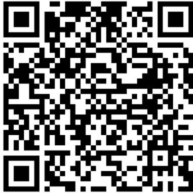
QR-Code Meldeplattform Asiatische Hornisse

Um möglichst rasch Maßnahmen zum Fang der Königinnen und Beseitigung der Nester der Asiatischen Hornisse zu veranlassen, bittet das Ministerium für Umwelt, Klima und Energiewirtschaft um Meldung von Sichtungen in Baden-Württemberg. Dies ist über die Meldeplattform auf der Homepage der Landesanstalt für Umwelt (LUBW), aber auch über die kostenlose „Meine Umwelt-App“ möglich: