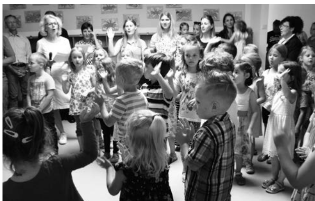
Mit einem musikalischen "Hallo" begrüßten die Kinder die Gäste beim Tag der offenen Tür

Ein Haus, in dem Freude wohnt, Leben pulsiert und alle glücklich sein können