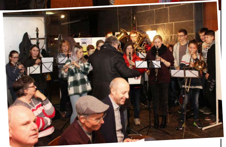
Die Jugendkapelle des Musikvereins eröffnete die Ausstellung.