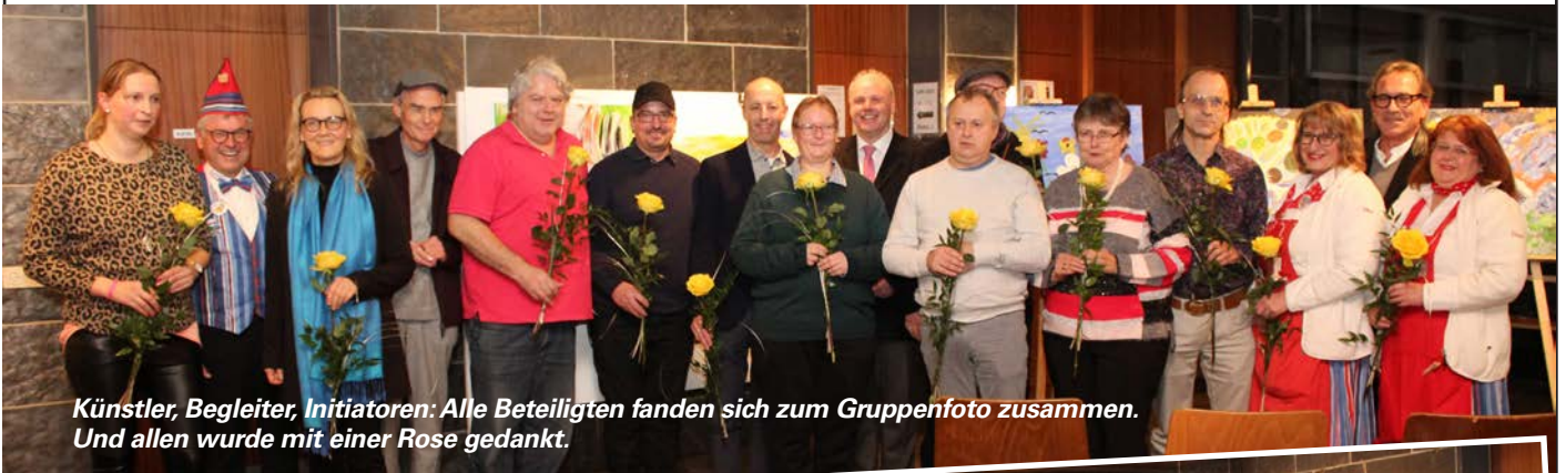
Künstler, Begleiter, Initiatoren: Alle Beteiligten fanden sich zum Gruppenfoto zusammen. Und allen wurde mit einer Rose gedankt.

Sechstes Kunstprojekt der Waldstetter Wäschgölten und Stiftung Haus Lindenhof wurde am 29. November 2019 im Rathaus mit einer Ausstellung eröffnet