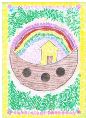
(Text und Bilder: Seelsorgeeinheit Unterm Hohenrechberg)