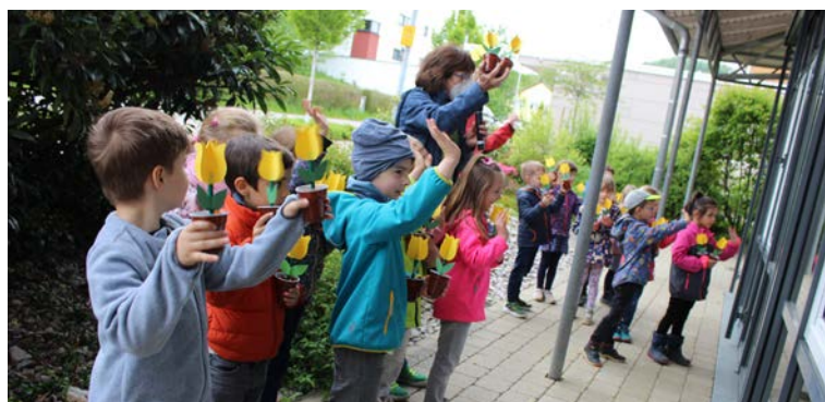
Die Kinder vom Kindergarten St. Vinzenz mit ihren selbstgebastelten Blumengrüßen.