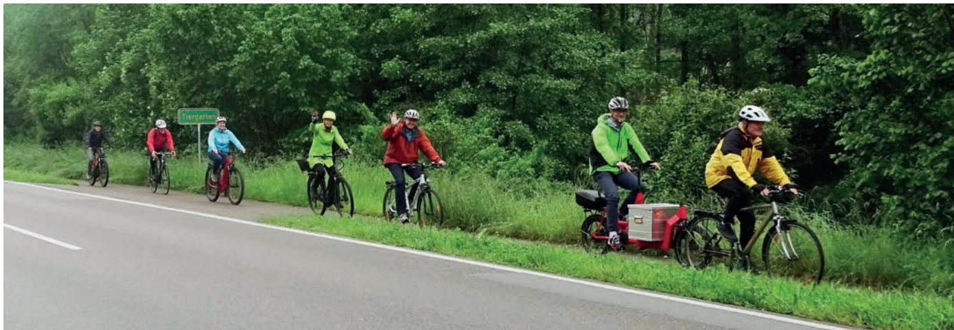
Die Waldstetter Gruppe unterwegs nach Schwäbisch Gmünd.

Jeder Radfahrer ist herzlich zur Teilnahme eingeladen – Anmeldung auch jetzt noch möglich