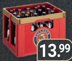
Paulaner Weißbier versch. Sorten, 20x0,5-l-Kiste zzgl. 3,10 € Pfand (1 l = 1,40 €)