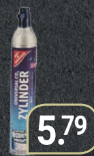
Gut & Günstig CO 2 Tauschzylinder für bis zu 60 L sprudelndes Wasser, 425-g-Füllung (1 kg = 13,41 €)