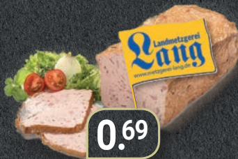
Fleischkäse grob und fein geschnitten oder Vesperscheibe 100 g