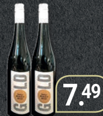
Weingut Leon Gold Edition Mangold weiß trocken 0,75-l-Flasche, (1 l = 9,99 €)