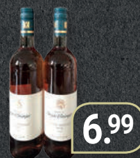
Weingut Jürgen Ellwanger Edition Mangold rosé 0,75-l-Flasche (1 l = 9,32 €)