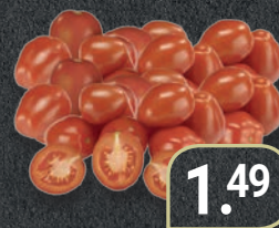
Roma Tomaten Deutschland 500 g Packung (1 kg = 2,98 €)