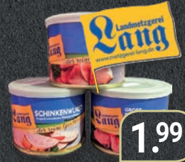
Wurst Dosen (200 g) versch. Sorten, Stück (1 kg = 9,95 €)