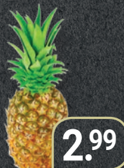
San Lucar Ananas Costa Rica, große Früchte Stück