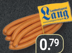
Saiten knackfrisch 100 g