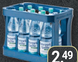
Naturpark Quelle Mineralwasser versch. Sorten, Kiste 12x1-l PET-Flaschen zzgl. 3,30 € Pfand (1 l = 0,20 €)