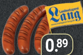
Rote Wurst Der Grillklassiker 100 g