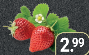
Deutsche Erdbeeren Schale 500 g (1 kg = 5,98 €)