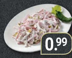
Fleischsalat hausgemacht 100 g