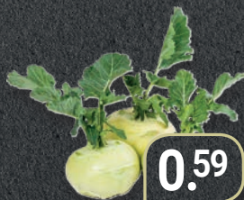
Kohlrabi Deutschland HKL I Stück