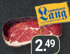
Kreuzbergschinken Rauchfleisch aus Nenningen 100 g