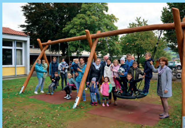
Als erster von drei Spielplätzen in Wißgoldingen wurde am Dienstagnachmittag der Kinderspielplatz bei der Grundschule wieder offiziell seiner Bestimmung übergeben.