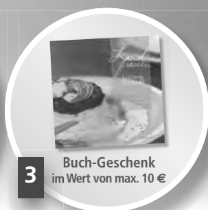
3 Buch-Geschenk im Wert von max. 10 €