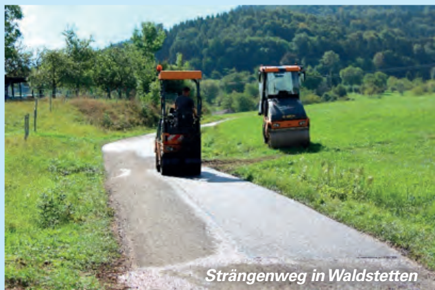
Strängenweg in Waldstetten

der Unterbau, wo nötig, geebnet und ein neuer Straßenbelag aufgebracht. Die Bilder zeigen die drei Wege, auf denen nun wieder ohne Ruckeleien gefahren werden kann.