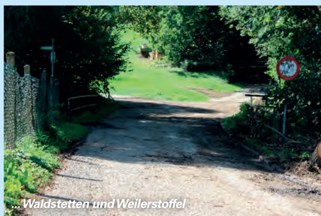
... Waldstetten und Weilerstoffel