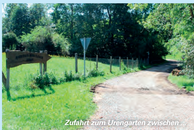
Zufahrt zum Urengarten zwischen ...