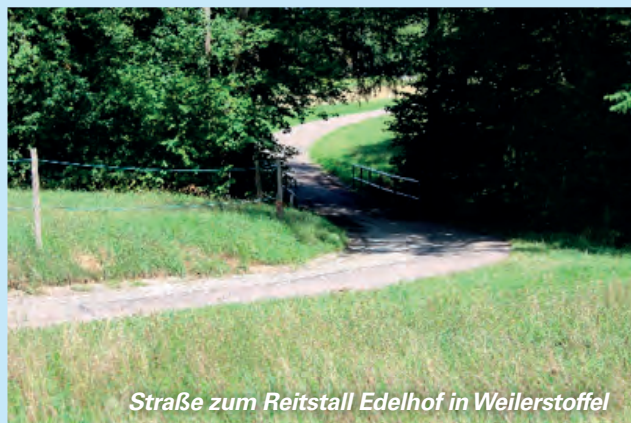
Straße zum Reitstall Edelhof in Weilerstoffel