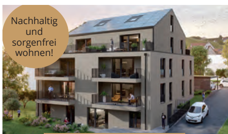
Remshalden, Stuttgartar Straße

Katholische Sozialstation Schwäbisch Gmünd Buchstraße 14 73525 Schwäbisch Gmünd Telefon 07171 92760-0 info@kath-sozialstation-gd.de www.kath-sozialstation-gd.de