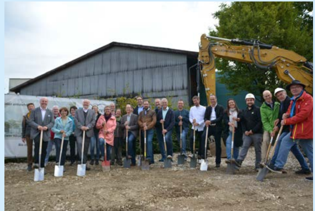
Alle am Bau Beteiligten – ob im Vorfeld oder aktuell - griffen gerne zum Spaten für das obligatorische Bild zum Start der Bauarbeiten des neuen Rathauses.

Juli 2021 – Das sogenannte Interimsrathaus in der Bettringer Straße 21, das später finanzschwächeren Bürgern oder Geflüchteten zur Verfügung stehen soll, wird von der Gemeindeverwaltung bezogen. Bevor das alte Rathaus im Herbst 2022 abgerissen wird, findet es noch eine Nutzung als Corona-Testzentrum, betrieben von der Stufen-Apotheke und dem Waldstetter DRK.