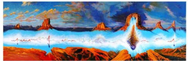
Symphonie Nr. 9, 2. Satz, Dvořák

Synästhesie: Ein Reiz (z.B.) eine Schwingung im hörbaren Frequenzbereich) löst eine primäre Wahrnehmung (einen Ton) und zugleich eine sekundäre Wahrnehmung (z.B. Farbe/Form) aus. Das verfälscht oder stört nicht die erste Wahrnehmung, sondern steigert einfach die Bandbreite des Erlebens.