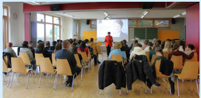
Rund 40 Zehntklässler kamen mit der Bundestagsabgeordneten ins Gespräch über die 60-jährige deutsch-französische Partner- und Freundschaft.

Ausstellungsdauer 04.11.2023 bis März 2024 Dienstags 14:00 bis 22:Uhr