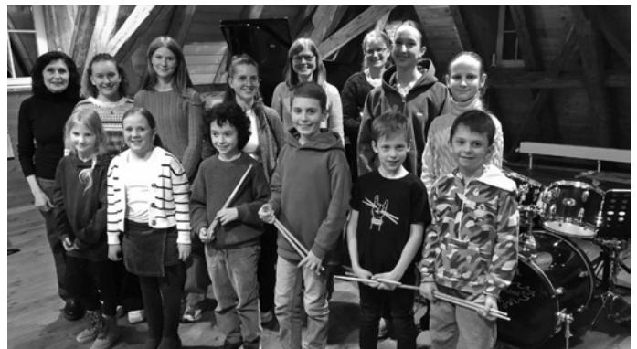
Die Teilnehmerinnen und Teilnehmer sowie die beteiligten Lehrkräfte

Wen dies begeistert hat, der kann sich am Sonntag, 25. Januar, den Regionalentscheid von JUGEND MUSIZIERT ab morgens 8.50 Uhr auf dem Kirchberg anhören: Die Wertungsspiele sind öffentlich. Besuch ist sogar ausdrücklich erwünscht. Für Bewirtung ist in der Cafeteria gesorgt.